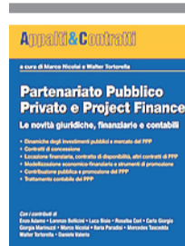
Il volume che tratta i temi del Ppp